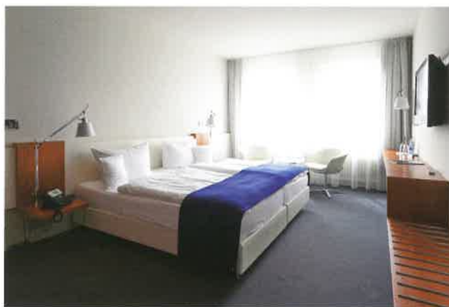
Titelbild: Holger Bär, Landesvertretung Baden-Württemberg, 2013 (Detail), Acryl auf Leinwand, 70 x 100 cm