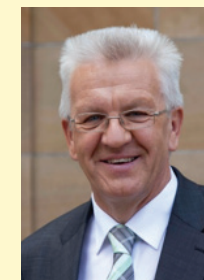
Winfried Kretschmann Ministerpräsident des Landes Baden-Württemberg

Ministerpräsident des Landes Baden-Württemberg