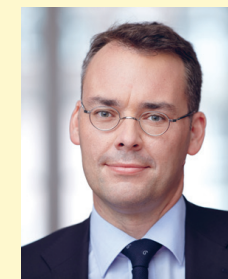
Peter Friedrich Minister für Bundesrat, Europa und internationale Angelegenheiten

Minister für Bundesrat, Europa und internationale Angelegenheiten